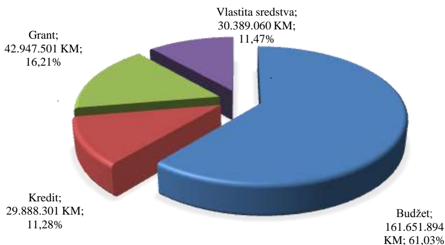
Grafikon 2. Vrste finansiranja projekata u PJI 2023-2025

Analizirajući načine finansiranja projekata uvrštenih Program javnih investicija Tuzlanskog kantona 2023-2025. godina, vidimo da je 84,28% sredstava domaćeg karaktera, dok je 15,72% sredstava iz inostranih izvora finansiranja. Posmatrano po vrstama finansiranja uvrštenih projekata, najveći iznos za finansiranje projekata izdvaja se u vidu budžetskih sredstava (61,03 %), dok su ostali izvori finansiranja zstupljeni u nešto manjim procentima učešća.